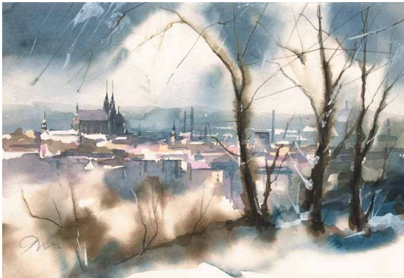
▲ Základem brněnské siluety je Petrov, jehož základy pamatují prvního moravského markraběte Konráda Otu (12. stol.)

The Brno skyline is based on Petrov, the foundations of which remember Konrád Ota, the first Moravian margrave (12 th century)